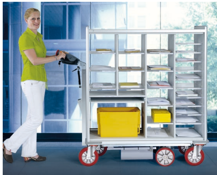
MOBIL: Dank der Transportwagen mit optionalem Elektroantrieb lassen sich selbst schwere Postgüter schnell und bequem von A nach B transportieren.

Wichtig ist auch eine optimale Möbelanordnung. Sie maximiert die Tageslichtausbeute, schafft mehr Bewegungsfreiheit für Mitarbeiter und hält alles Nötige in Reichweite. So liegen beispielsweise beim Postausgang die Fächer für Porto- und Kostenstellensortierung direkt über dem Frankiersystem. An Packtischen sind die Kartonnagen im oberen Tischbereich genauso schnell griffbereit wie Papierschnneider und Füllmaterial unterhalb der Arbeitsfläche. Und eine tischintegrierte Paketwaage wiegt die Packstücke